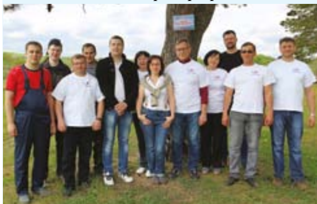
Экологическая акция «Чистый берег». Работники АО «Авангард» и представители Индустриального парка «Сафонов» на берегу реки Днепр