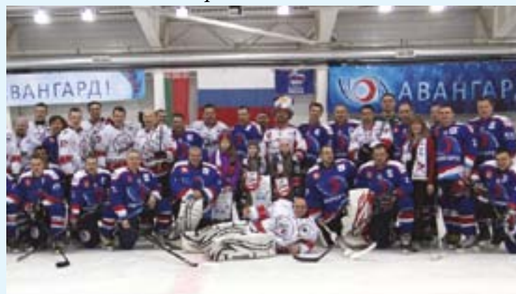
Спортивный праздник от АО «Авангард». ХК «Авангард» и команда артистов «КомАр» из Москвы в физкультурно-оздоровительном комплексе «Сафоново Спорт-Арена»