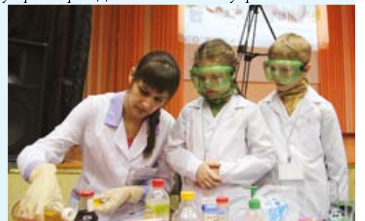
Первые химические опыты. Представители Совета молодых работников АО «Авангард» во время проведения коллективно-творческого дела по наукам среди учащихся начальных классов МБОУ «СОШ №8»