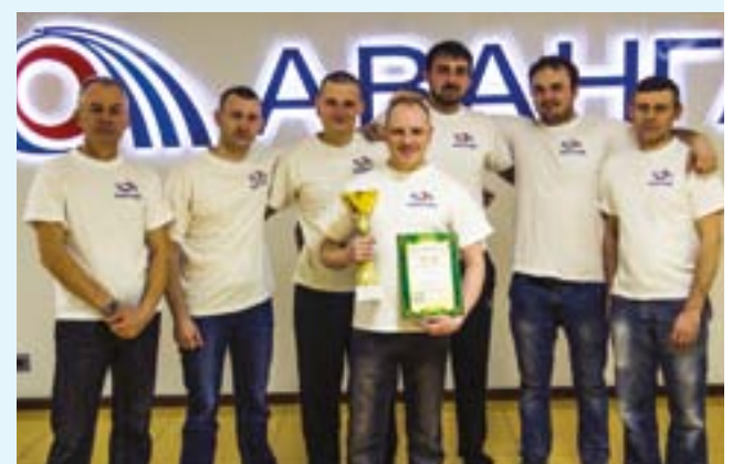
Волейбольная команда АО «Авангард», занявшая первое место в первенстве коллективов физической культуры Сафоновского района по волейболу среди мужчин