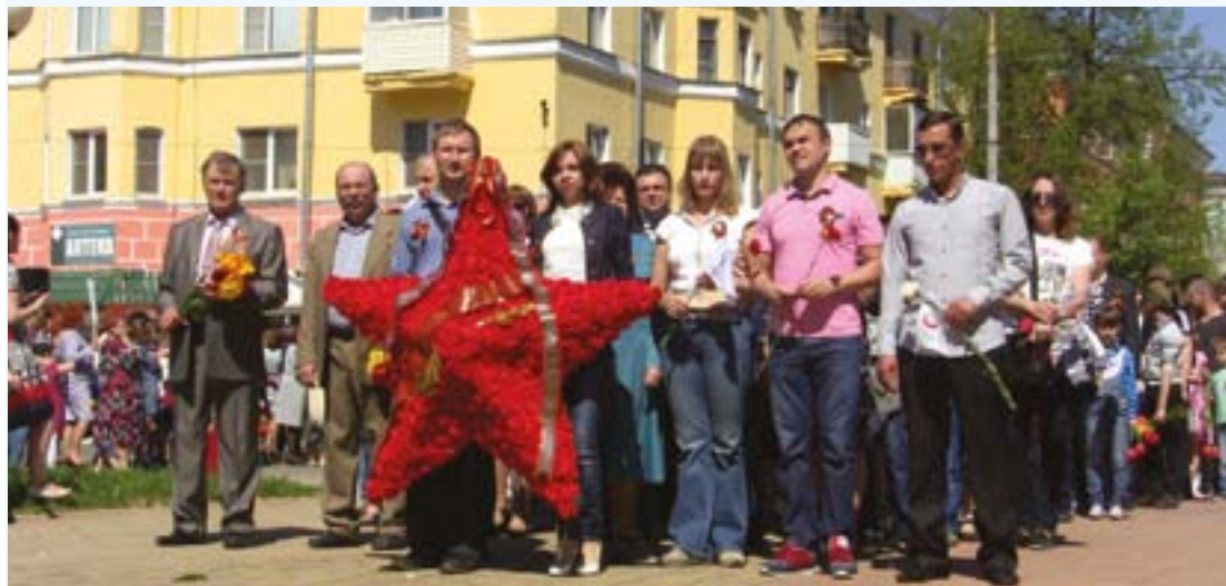
Делегация АО «Авангард» на митинге, посвященном Дню Победы. В этот день представители предприятия возложили венки к братским могилам в деревне Какушкино Сафоновского района и к памятному знаку на территории Сафоновского индустриально-технологического колледжа