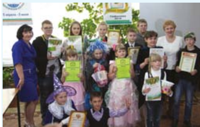
Награждение победителей 14-го районного экологического фестиваля «Познавая, сохраняй!». АО «Авангард» – генеральный спонсор, входящий в состав жюри мероприятия