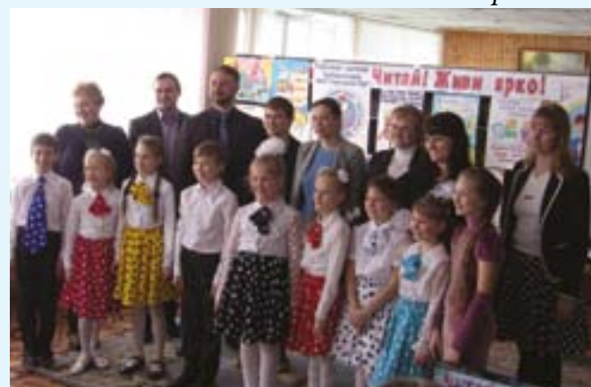
Представители АО «Авангард» на финальном мероприятии награждения победителей ежегодного литературного конкурса «Лидеры чтения 2016»